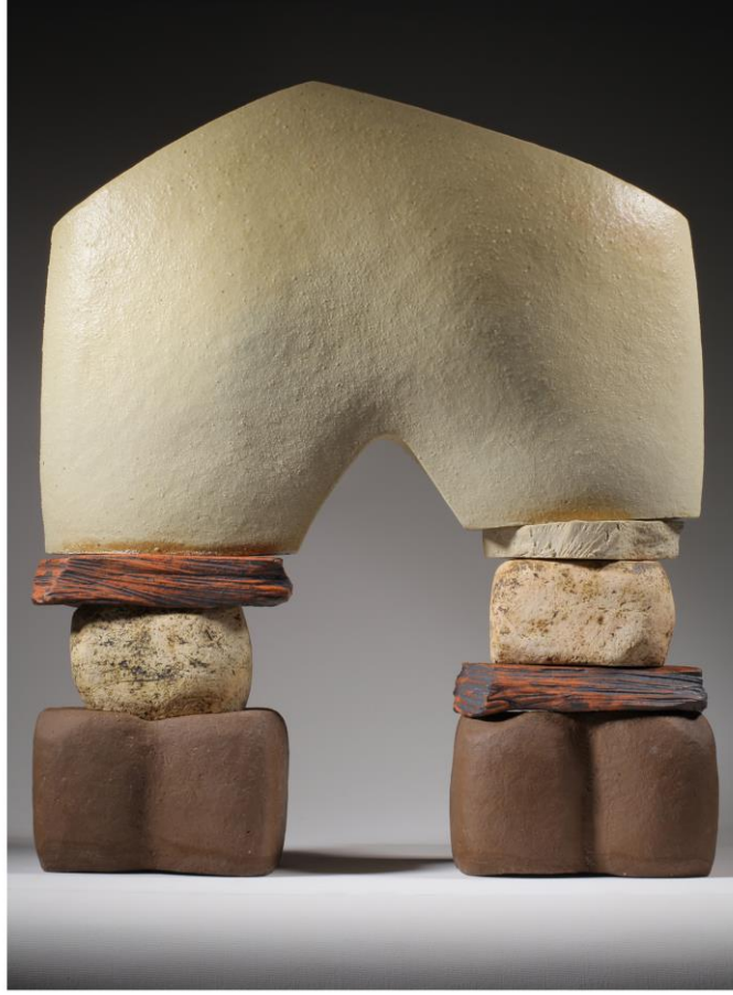
Pınar ÇALIŞKAN GÜNEŞ, "Stel 3", Stoneware, Serbest Şekillendirme, Kül Sırı, 1280°C, 40x47x10cm, 2015.

sosyal mesafe social distance sanal sergi virtual exhibiton haziran 2020 june 2020